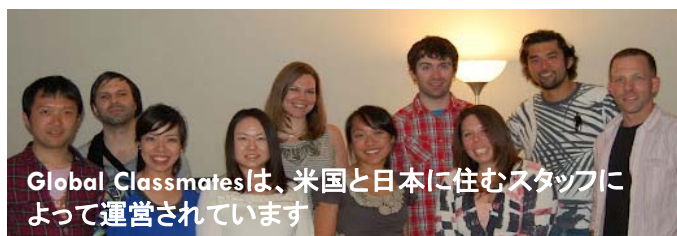
Global Classmatesは、米国と日本に住むスタッフによって運営されています

企画・運営する「Global Classmates (グローバル・クラスメート)」では、専用のSNSページ上で日米の生徒がコメントのやり取り、写真・動画の投稿を通じた交流を行います。KACのコーディネータなどのスタッフが各ペアをサポートし、一緒に生徒の交流を盛り上げます。