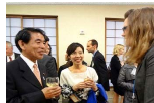
教育関連意見交換会にて下村文部科学大臣と