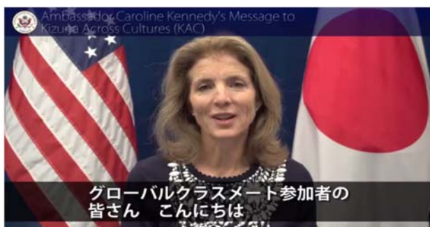
グローバルクラスメート参加者の皆さん こんにちは

Above: キャロライン・ケネディ在日米国大使よりビデオメッセージ (2015.2.11)