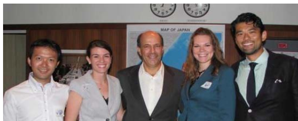
米国大使館にてルース駐日米国大使(当時)と